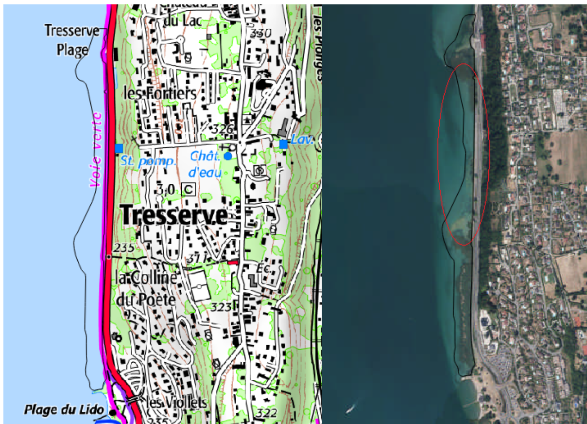
Figure 1 : Rive du poète - secteur Nord de la plage du Lido